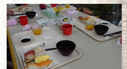
皆さんで楽しく美味しいひと時。おかわりもたくさんされていました(^ ^)