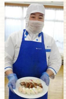
目の前で握りたてのお寿司！