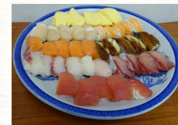
肉厚で立派なお寿司がご利用者さんの元へ運ばれます(*^^*)

今、資格取得の段階です。10年後は、今より1、2ステップ上がってほしいと思います。資格の種類によっては、携われる分野も広がるので、活躍の場も増えてほしいです。