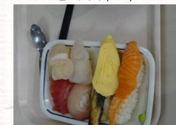
お好きなネタをチョイス！