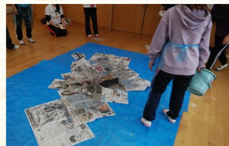
素早く新聞で覆い、空気感染を防止。汚れた衣服と共にハイターをしっかりと振りかけ…