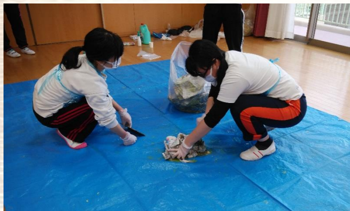
しっかりと拭き取り、ゴミ袋へ密封。スピードだけではなく、拭き残がないかしっかりと確認します