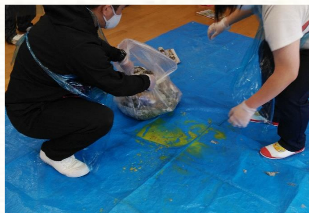
素早く撤去！職員は使い捨てエプロンと手袋着用で自らを守る対策もしっかりと！