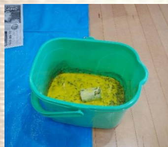
嘔吐物に見立てた塗料を、子どもの顔の高さからビニールシートに落とします