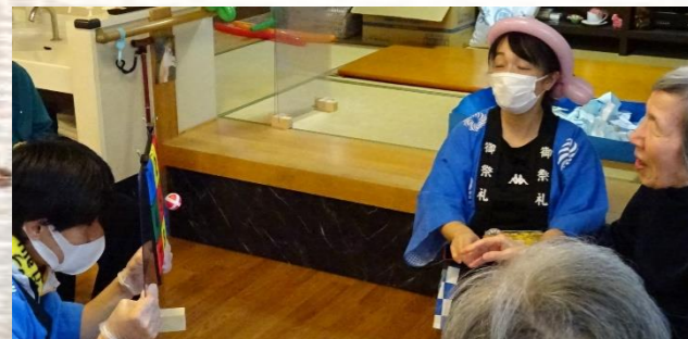
みごとの中！おめでとうございます☆お好きなハーバリウムをプレゼント(^-^) お部屋のアクセントに(*>>><<<*)。♡