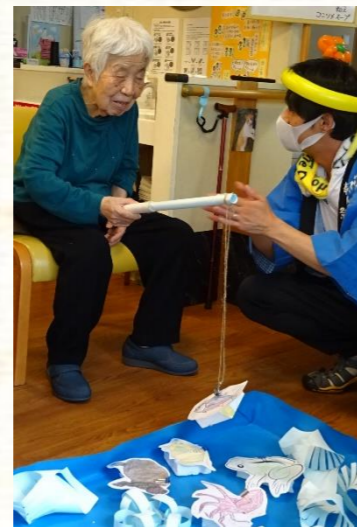
お見事！おめでとうございます(^ω^)