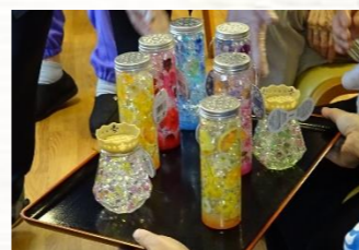
的当ての景品はキラキラのハーバリウム(^ω^)