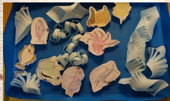
魚やカエルを吊り上げると、柔らかいふわふわタオルのプレゼント♡