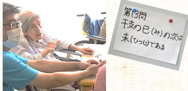
子・丑・寅・卯・辰…隣で一緒に数えて、うっかり答えを教えてしまう施設長です…(^ω^)