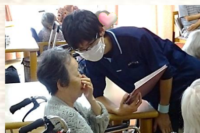
タイムアップ！「ファイナルアンサー？」