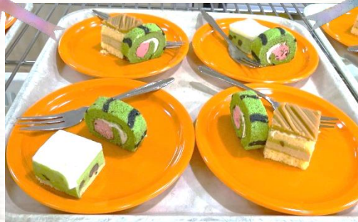
糖分補給☆ かわいいケーキでほっこり(^-^)