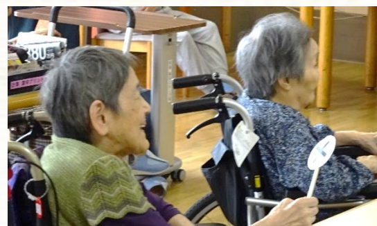
職員の楽しい進行に、思わず笑顔に(^-^)