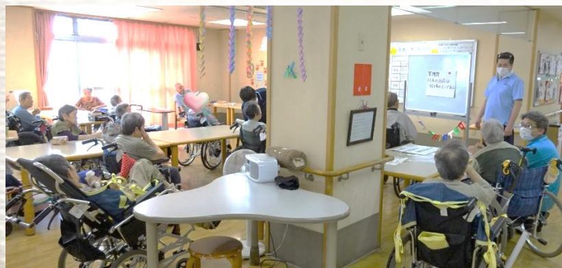
次々と出されるクイズにビビッと直感で回答される方、じっくり考えて回答される方、それぞれのペースで楽しまれていました(*^^*)