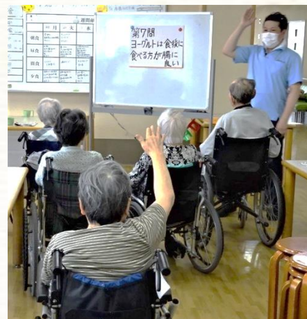
「はいっ！」みごと正解です♪