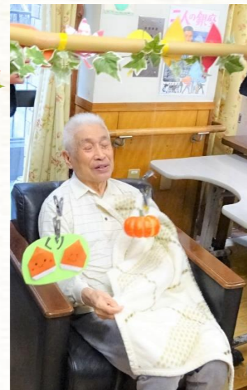
どれも好きだと、なかなか決められません(^-^)