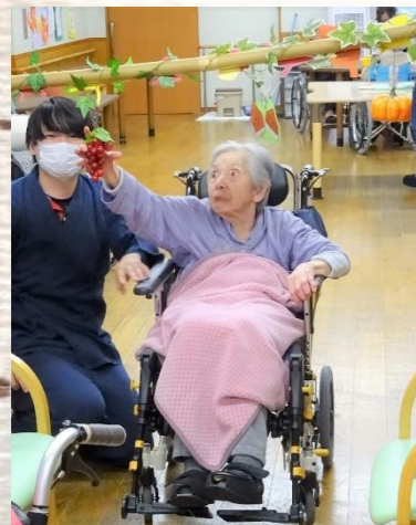
ぶどう選ばれました♪もう少しです！

秋ならではの...ということもあってか、くりが人気！ みなさん好みのゼリーを美味しく召し上がられました(*^_^*)