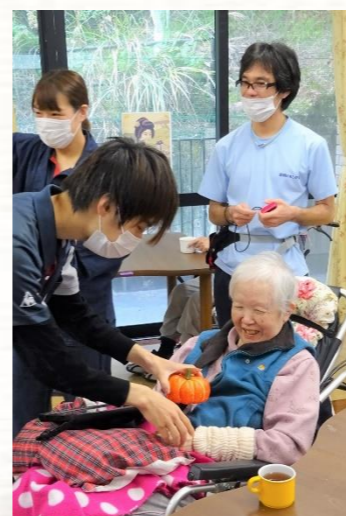
かぼちゃをもぎ取り、笑顔に(*^_^*)

秋ならではの...ということもあってか、くりが人気！ みなさん好みのゼリーを美味しく召し上がられました(*^_^*)