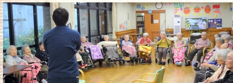
職員が味覚狩りの説明をしています(^ω^) 楽しくおいしい時間にしましょう！