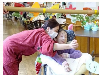
職員もお手伝いさせていただきます(^-^) 一緒に(^-^)