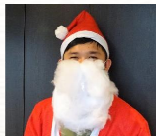
最後は！サンタさんから皆さまへプレゼント(^_^)☆職員がお預かりしました♪