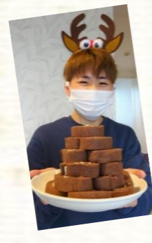
ロールケーキをデコレーションして、オリジナルケーキを作ってくださいます☆ とっても美味しそうにできました！