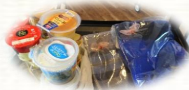
BINGOゲームの景品はひざ掛けとプリン♪