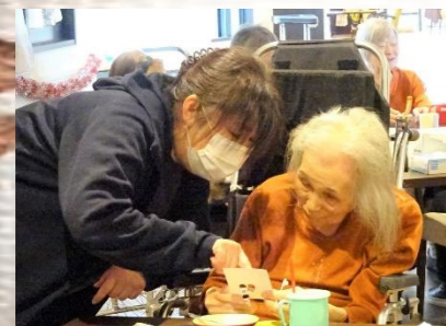
惜しい！次こそはBINGO狙いましょう！