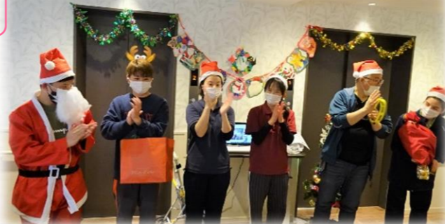
楽しい時間はあっという間でした(^_^)ありがとうございました！