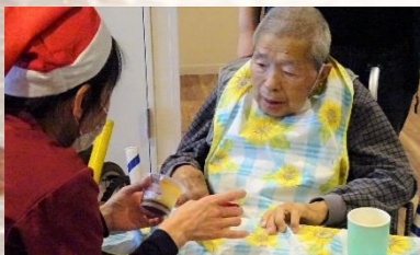
BINGOしました！プリンをGETです(^_^)