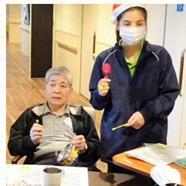
♪歌の時間♪ 皆さま大きな声で「赤鼻のトナカイ」「きよしこの夜」など歌われていました(^_^) 鈴の音も軽やかに、クリスマスらしさがアップ！