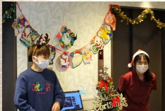
職員も進行頑張ります！楽しい時間にしましょう♪