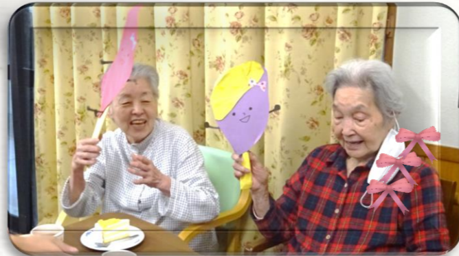
おしゃべりにも花が咲き、笑顔で楽しい時間を過ごされていました(^^)