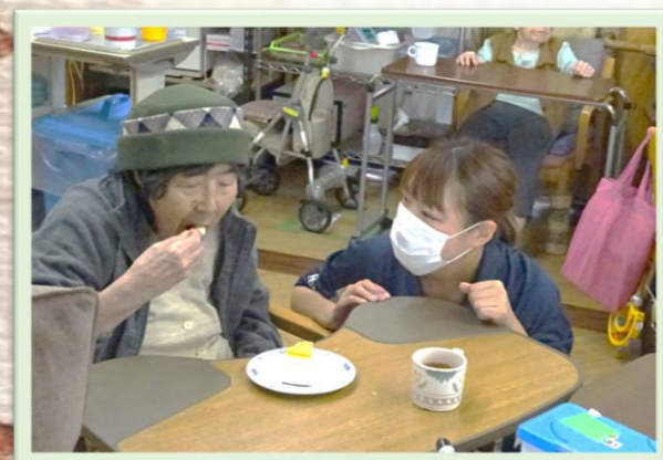
自分で選ぶデザートは、お腹はもちろん、気持ちも満たされますね(´-`) 皆さまゆったりと味わっておられました♪