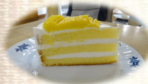
～モンブランケーキ～ クリームが2層仕立てでボリューム満点！美味しそう(*'ω'*)