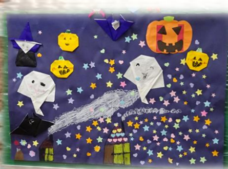
ともしび保育園 園児さんの作品です！ かわいい作品をありがとう♪