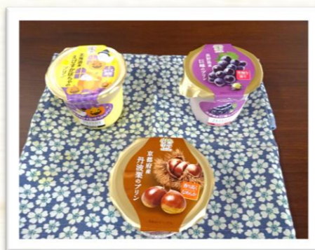
～プリン3種～ 丹波栗、えびすかぼちゃ、巨峰の3つの味(´-`)