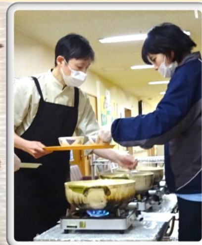
慌ただしい中でも、必要に応じて具材を小さめにカットしたり、食材をバランスよく盛り付けたり、 職員間で協力してスムーズご提供できました(*^-^*)