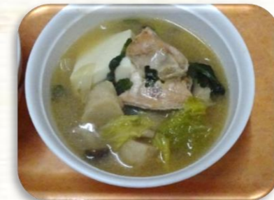
大きな鮭の切り身入り♪ 味噌と鮭の相性は抜群ですね! 美味しそう!