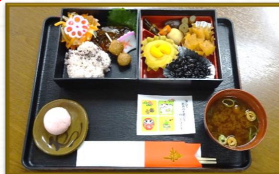
1月5日の飛鳥ともしび苑のランチは 豪華なおせち料理でした(^-^)