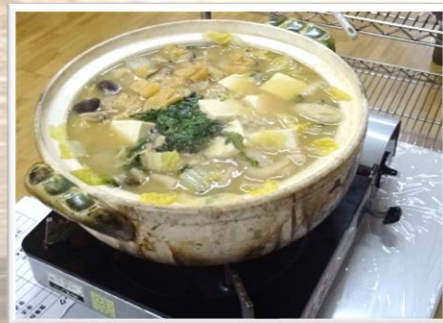
野菜、豆腐、つみれ、鶏肉に鮭まで入った 旨みたっぷりの具たくさんお鍋☆

1月25日、福島ともしび苑では昼食に具たくさんのお鍋を召し上がっていただきました(^-^) 身も心も温まる味噌仕立ての鍋は、ホッとするお味で香りも良く、「美味しいわ～」と思わず声が出てしまうほど好評☆ フロアいっぱいの味噌の香り、食欲が刺激されますね(*^_^*)