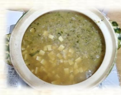
具材を細かく刻んだお鍋もご用意 (^-^)